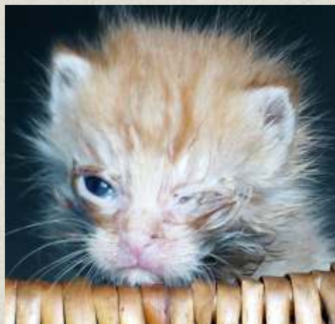
Arion à son arrivée...

veillé sur moi et dès le lendemain j'ai pu entrevoir une lueur d'espoir à l'horizon ! Aujourd'hui, quelques centaines de biberons et une infinité de câlins plus tard, me voici devenue une magnifique petite chatte, au joli nom de Arion (cheval mythique immortel), aimée, choyée, pleine de vie, dont les priorités sont bien clairement les caresses, les ronrons et les jeux turbulents avec mon frère et ma sœur adoptifs: Amur, le grand tigre et Muki, la petite