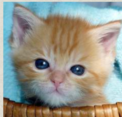
... le même chaton un mois plus tard !