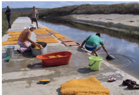
Nettoyage des tapis des chats à la main, vive nos installations high tech !