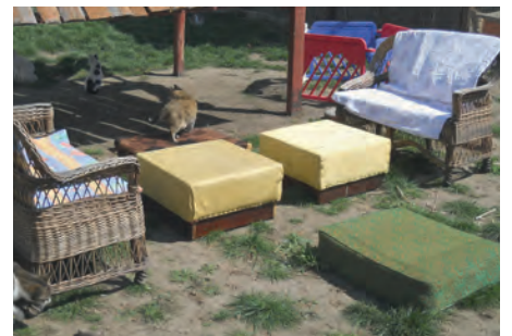
Salon d'été des pensionnaires à quatre pattes et des visiteurs aux mains tendres.