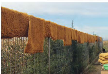
Séchage des tapis au soleil